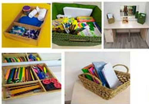
ЗОНА ТВОРЧЕСТВА: КРАСКИ, ПЛАСТИЛИН, КАРАНДАШИ, БЛЕСКИ, КЛЕЙ, КАРТОН, ВАТА, ЦВЕТНАЯ БУМАГА, ПЕРГАМЕНТНАЯ БУМАГА, НОЖНИЦЫ